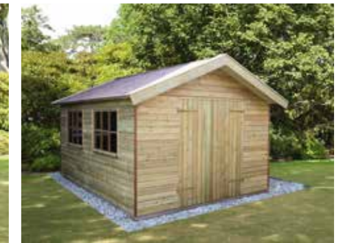
Tuinhuisje F 330 x 420 cm Extra: dubbele dichte deur.