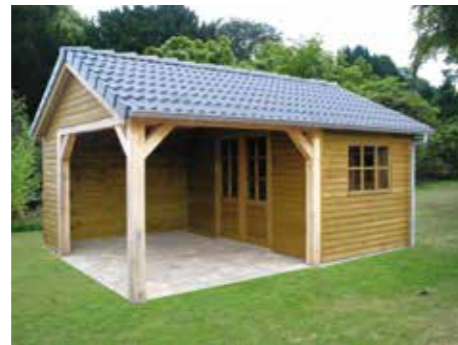
Tuinhuisje met terras B 540 x 390 cm Incl. zinken goot Met betonpannen dak en eiken balken