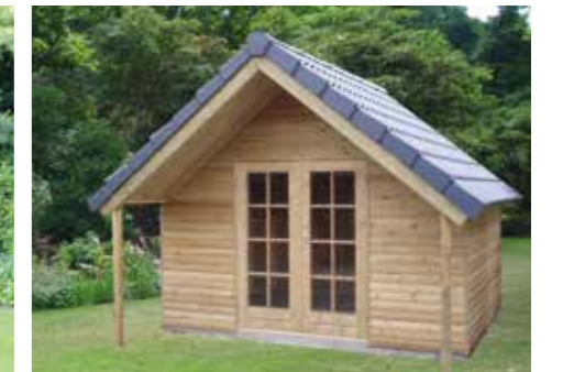
Tuinhuisje met steile hellingshoek 300 x 270 cm