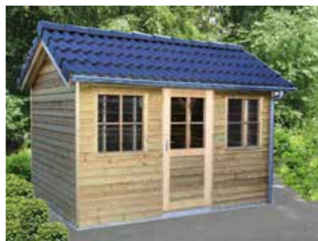
Tuinhuisje 'Verkeerd om' A 330 x 240 cm Extra: pannendak en zinken goot