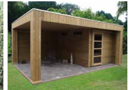
Tuinhuisje met plat dak I 630 x 420 cm