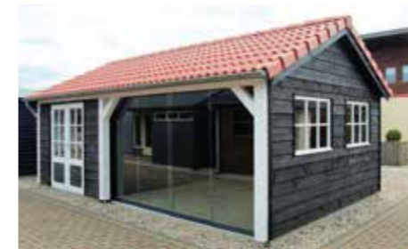
Tuinhuisje met terras I 690 x 420 cm Incl. zinken goot Met betonpannen dak en eiken balken, eventueel met glazen schuifwand