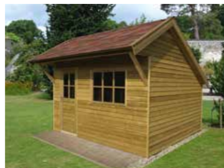
Tuinhuisje 'Verkeerd om' B 360 x 330 cm Extra: luifel 60 cm