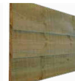
Zweeds rabat geïmpregneerd