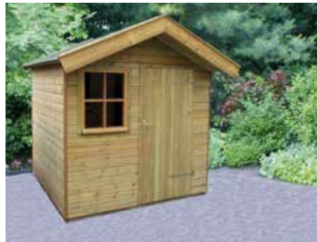
Tuinhuisje A 210 x 210 cm

We laten hier een aantal basismodellen zien. Wij kunnen alles naar uw wens aanpassen zoals deur, dubbele deuren, ramen, dakoverstekken, hoogtes, etc. Laat u inspireren door de basismaten en laat ons weten wat uw wensen zijn. Wist u dat u ook kunt kiezen uit verschillende profielsoorten planken?