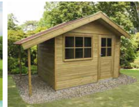
Tuinhuisje E 300 x 210 cm Met afdak zijkant van 90 cm