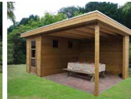
Tuinhuisje met plat dak D 510 x 300 cm