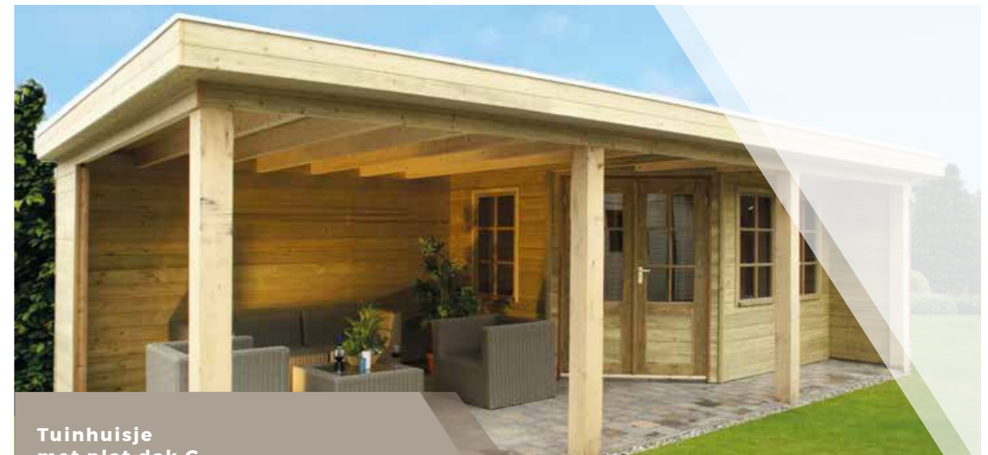
Tuinhuisje met plat dak G 780 x 390 cm Met eiken standers 15 x 15 cm.