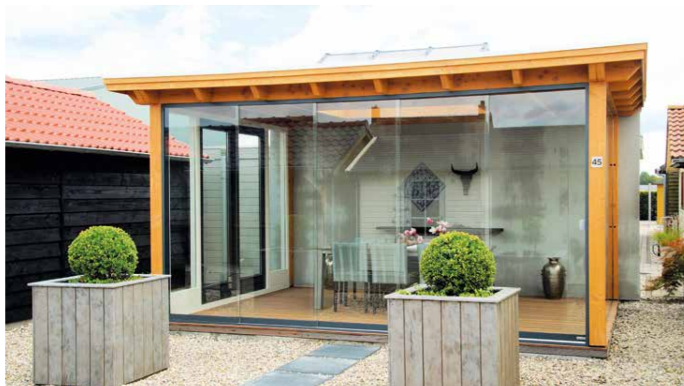
Overkapping A 480 x 360 cm In Douglas uitgevoerd.

Wij plaatsen houten overkappingen in vele maten en uitvoeringen. Wij leveren iedere overkapping op maat en naar wens. Daarnaast is het ook mogelijk om verschillende soorten materiaal te gebruiken of om een lichtkoepel te laten plaatsen. Prijzen zijn afhankelijk van de maatvoering en de te gebruiken materialen. Kortom: 'mooi maatwerk'.