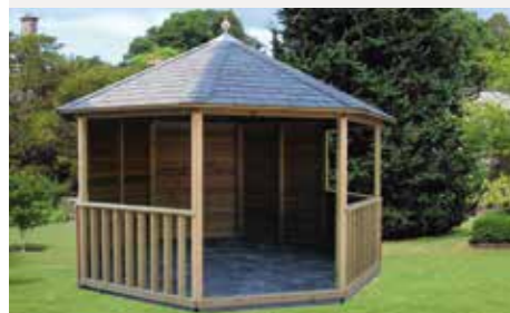
Diameter 315 cm

210 x 210 240 x 240 270 x 270 300 x 300 330 x 330 360 x 360 390 x 390