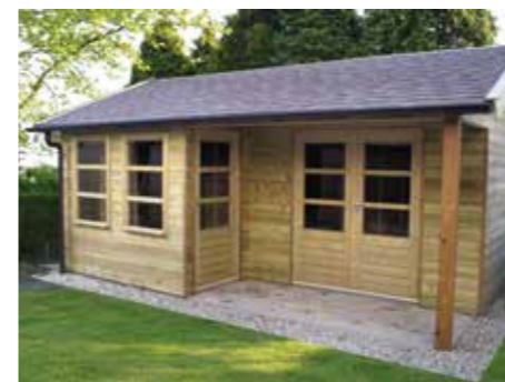
Tuinhuisje 'Verkeerd om' D 540 x 390 cm