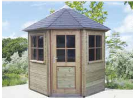
Tuinhuisje 8-hoekig A Diameter 255 cm