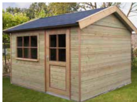
Standaard model 'Verkeerd om' 300 x 270 cm

Door de topgevels op de zijwanden te plaatsen ontstaat er een geheel ander aanzicht dan bij de traditionele tuinhuisjes. Op deze pagina's laten we enkele voorbeelden zien. Uiteraard kunnen we samen met u naar de vele andere mogelijkheden kijken. Uw eigen idee is zeer welkom en altijd de moeite waard om te bespreken.