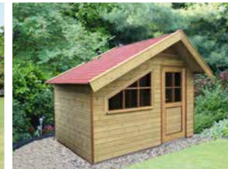
Tuinhuisje asymmetrisch 300 x 210 cm