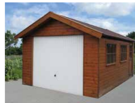
Garage standaard 360 x 600 cm Incl. 2 ramen, 1 deur en een stalen kanteldeur.

Voorfront in cm 300 - 330 - 360 - 390 420 - 450 - 480 - 510