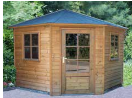
Tuinhuisje 5-hoekig met 3-zijdig dak 270 x 270 cm

Ook onze tuinhuisjes 5-hoekig zijn leverbaar in diverse afmetingen en met verschillende daken. Op deze manier vindt u altijd wel een tuinhuisje dat zowel qua prijs als qua stijl bij de rest van uw tuin past.