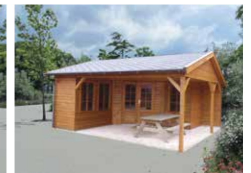
Tuinhuisje met terras H 540 x 480 cm Incl. gootwerk, 3 ramen en dubbele deur