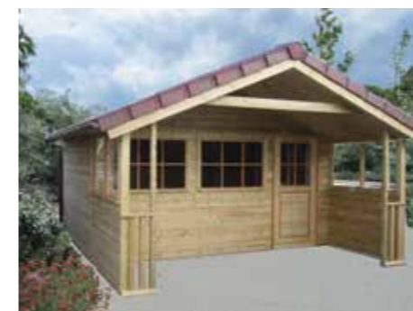
Tuinhuisje met terras E 420 x 360 cm Luifel 180 cm Extra: Glas in zijgedeelte en hekwerkje van ca. 40 cm Incl. gootwerk Met betonpannen dak