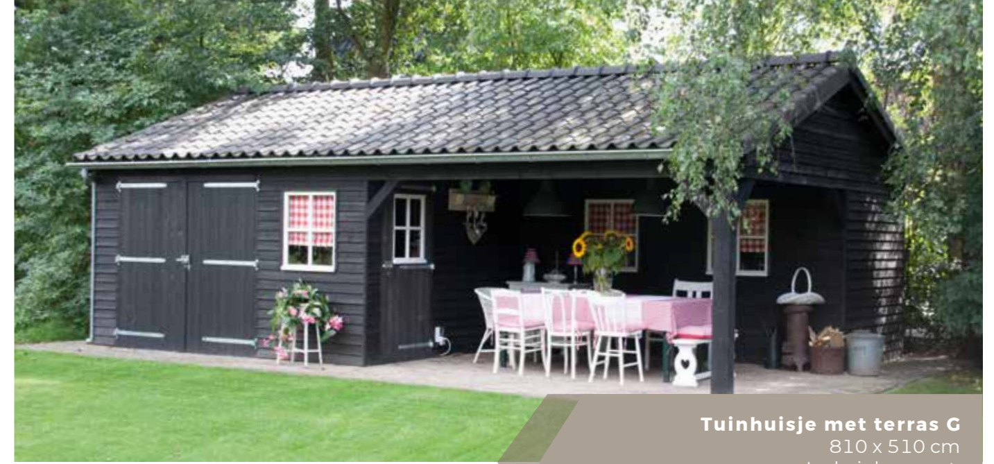
Tuinhuisje met terras G 810 x 510 cm Incl. zinken goot, met betonpannen of gebakken pannen.

Een tuinhuisje van Tuinhuisjescentrum Van de Munckhof is op verschillende manieren uit te voeren met een veranda of een overkapping. Bekijk hier ons uitgebreide assortiment of informeer naar de mogelijkheden van uw favoriete tuinhuisje met overkapping.