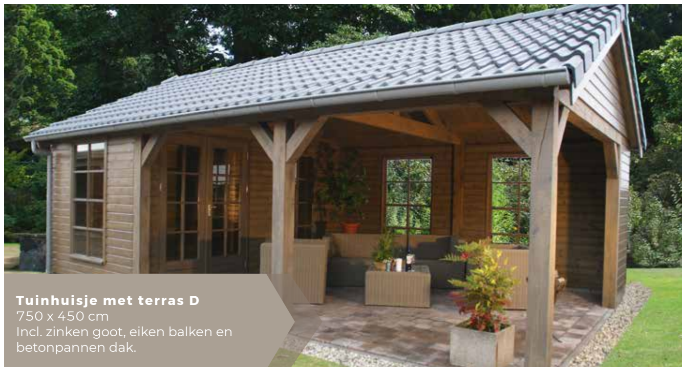
Tuinhuisje met terras D 750 x 450 cm Incl. zinken goot, eiken balken en betonpannen dak.