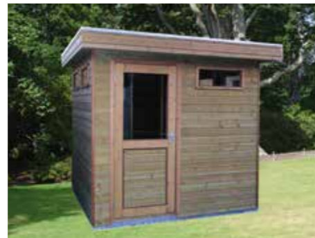
Tuinhuisje met plat dak A 240 x 240 cm Incl. glas deur en 5 bovenramen