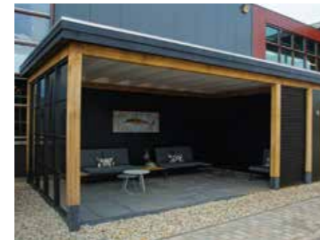
Tuinhuisje met plat dak F 810 x 390 cm Uitgevoerd met eiken standers en liggers