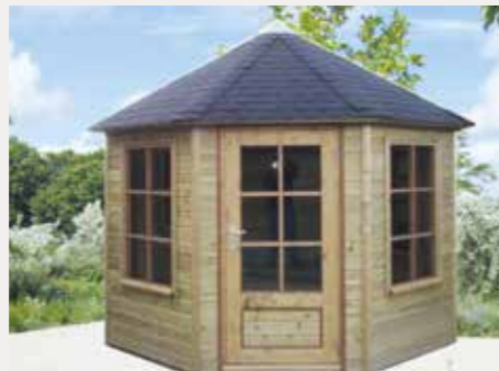
Tuinhuisje 8-hoekig B Diameter 315 cm