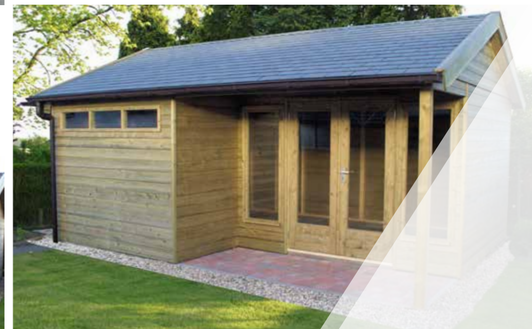
Tuinhuisje 'Verkeerd om' E 540 x 390 cm