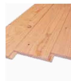
Douglas sponning delen blank