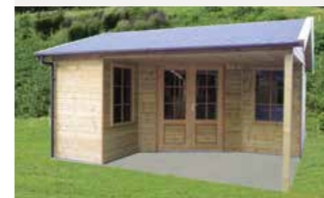
Tuinhuisje met terras J Totaal 450 x 390 cm Incl. gootwerk en dubbele deur