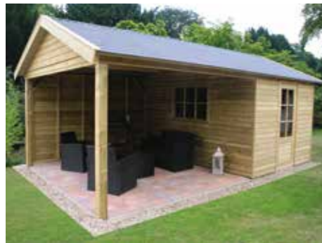
Tuinhuisje met terras A 600 x 360 cm Incl. pvc goot