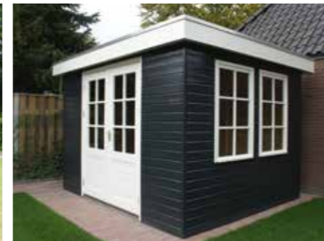
Tuinhuisje met plat dak B 300 x 270 cm Incl. dubbele deur en 2 ramen. Extra: Boeiboord Multipaint