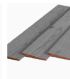
Douglas Zweeds rabat grijs