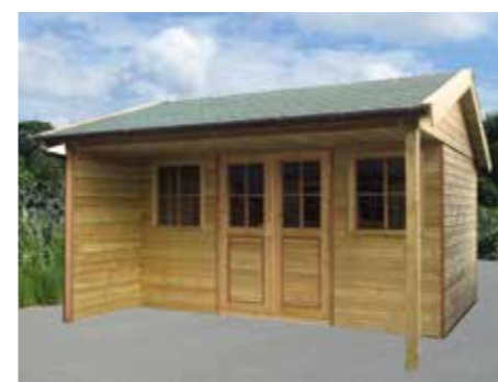
Tuinhuisje 'Verkeerd om' C 390 x 390 cm Extra: 120 cm oversteek