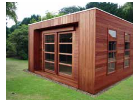
Tuinhuisje met plat dak C 420 x 330 cm Incl. schuifdeur en 2 ramen Uitgevoerd in Padouk

Aangezien we bij Tuinhuisjescentrum Van de Munckhof uw tuinhuisje met plat dak speciaal op maat maken, voldoet dit aan al uw eisen en wensen. Bekijk hier ons ruime aanbod of informeer naar de mogelijkheden voor uw eigen tuinhuisje.