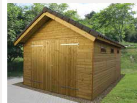
Garage B Afm. 480 x 600 cm Incl. 2 ramen, 1 deur, stalen kanteldeur en zinken goot