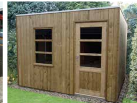
Tuinhuisje met plat dak H 330 x 330 cm