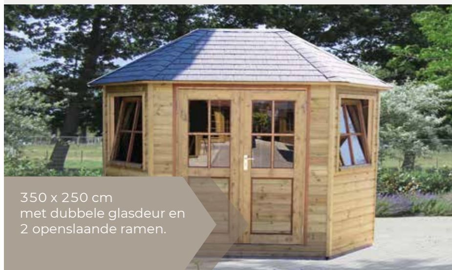
350 x 250 cm met dubbele glasdeur en 2 openslaande ramen.