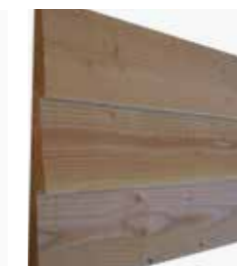
Douglas Zweeds rabat blank