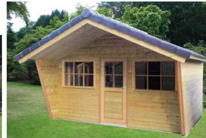
Tuinhuisje H 420 x 300 cm Extra: schuine luifel van 90 cm verlengd tot 150 cm Met shinglesdak of met betonpannedak