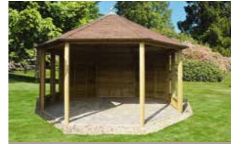
Diameter 440 cm

Een prieeltje biedt u de mogelijkheid om de voordelen van een overkapping te combineren met het genieten van het vrije uitzicht dat u door middel van de open zijanten behoudt. Hieronder ziet u een greep uit ons assortiment prieeltjes.