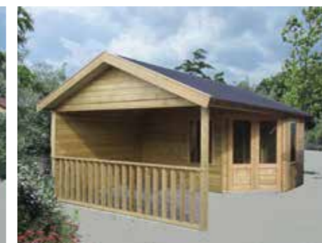
Tuinhuisje met terras F 600 x 390 cm Terrasafmeting 300 x 390 cm Incl. gootwerk