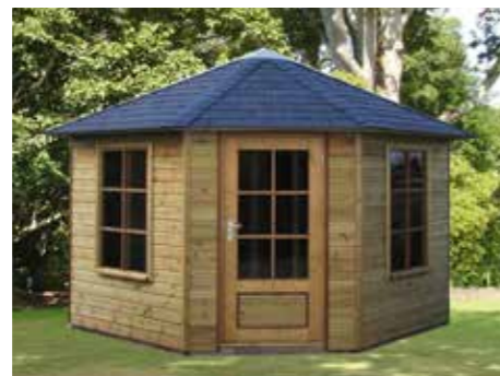
Tuinhuisje 5-hoekig met 5-zijdig dak B 270 x 270 cm