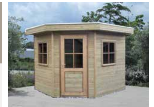
Tuinhuisje 5-hoekig met plat dak 270 x 270 cm

210 - 240 - 270 - 300 - 330 - 360 - 390 - 420 - 450