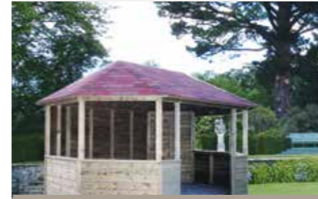
390 x 275 cm

Diameter 440 cm. 3 dichte wanden, 2 wanden met 2 ramen, 3 open wanden.