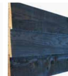
Douglas Zweeds rabat zwart