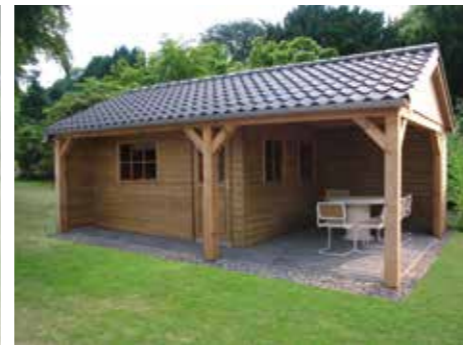
Tuinhuisje met terras C 690 x 420 cm Incl. zinken goot Met pannendak en eiken balken