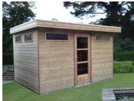
De basis: tuinhuisje met plat dak 390 x 270 cm