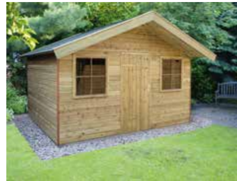
Tuinhuisje C 360 x 300 cm