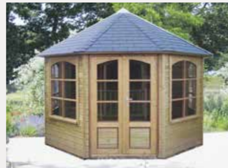
Tuinhuisje 8-hoekig C Diameter 350 cm Extra: 4 getoogde ramen en getoogde dubbele deur