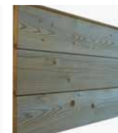
V-groef delen geïmpregneerd