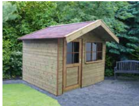
Tuinhuisje B 270 x 240 cm