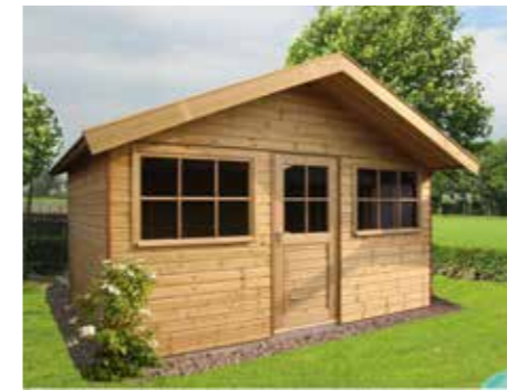
Tuinhuisje D 420 x 300 cm