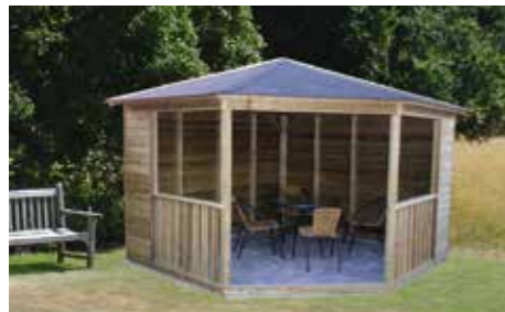
300 x 300 cm