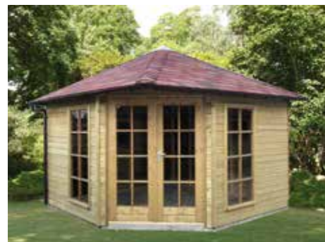
Tuinhuisje 5-hoekig met 4-zijdig dak A 330 x 330 cm Extra: een dubbele deur

210 x 210 240 x 240 270 x 270 300 x 300 330 x 330 360 x 360 390 x 390 420 x 420