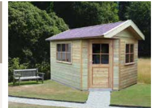
Tuinhuisje 5-hoekig met 4-zijdig dak 330 x 240 cm

210 - 240 - 270 - 300 - 330 - 360 - 390 - 420 - 450