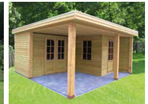
Tuinhuisje met plat dak E Totaal 510 x 510 cm Incl. terras en schuifdeur