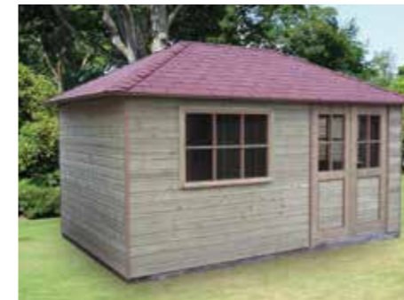
Tuinhuisje met schilddak 420 x 270 cm 1 dubbele glasdeur en 1 raam

Door gebruik te maken van een andere hellingshoek van het dak ontstaat er een geheel ander huisje dan het traditionele tuinhuisje.