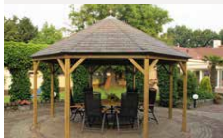
Diameter 440 cm