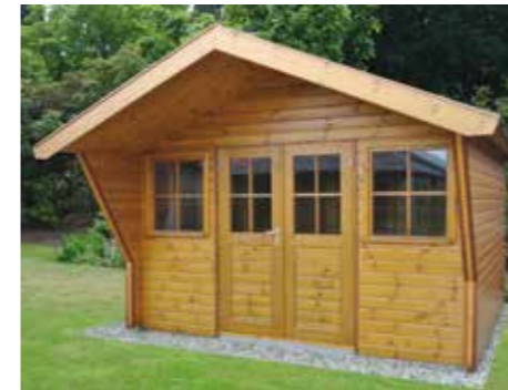
Tuinhuisje G 360 x 300 cm Extra: dubbele deur, luifel met knik en verlengd tot 120 cm